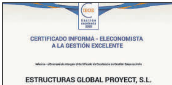
Sus representantes no pudieron acudir.

Denominación Social: Espacio Aretha Forma jurídica: Sociedad Limitada Ubicación: Madrid Número de Empleados: 10 Facturación: 3 millones