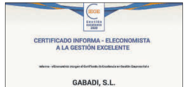
Sus representantes no pudieron acudir.

Denominación Social: Freedom Sea Agencia de Suscripción Forma jurídica: SLU Ubicación: Castellón Facturación: 0,5 millones