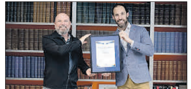
Los representantes de Gloria Pets recogiendo el certificado.

Denominación Social: Inmunotek Forma jurídica: Sociedad Limitada Ubicación: Madrid Número de Empleados: 236 Facturación: 34 millones