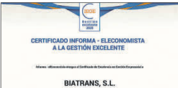
Sus representantes no pudieron acudir.

Denominación Social: Berbés Asociados Forma jurídica: Sociedad Limitada Ubicación: Madrid Número de Empleados: 20 Facturación: 1,8 millones