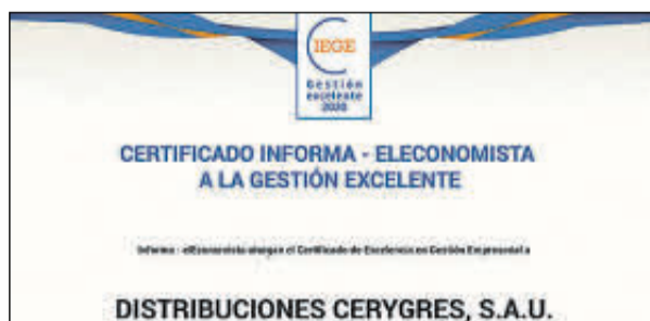
Sus representantes no pudieron acudir.

Denominación Social: Desarrollo y Fomento Comercial Forma jurídica: Sociedad Limitada Ubicación: Madrid Facturación: 1,8 millones