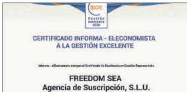
Sus representantes no pudieron acudir.

Denominación Social: Formación Universitaria Forma jurídica: Sociedad Limitada Ubicación: Sevilla Facturación: 8,5 millones