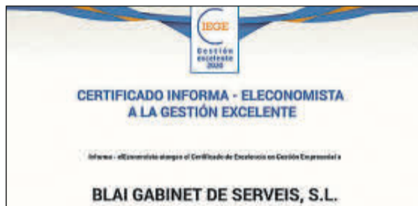
Sus representantes no pudieron acudir.

Denominación Social: Biatrans Forma jurídica: Sociedad Limitada Ubicación: Madrid Número de Empleados: 141 Facturación: 13 millones