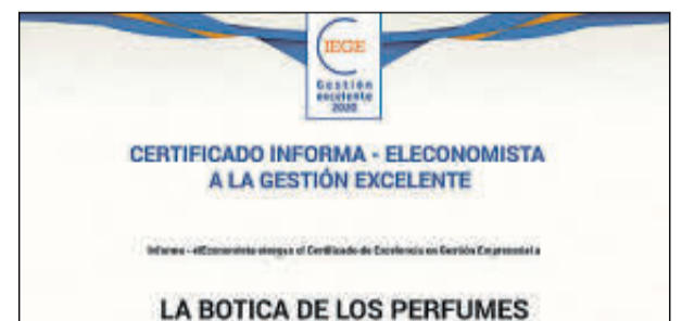
Sus representantes no pudieron acudir.

Denominación Social: Distribuciones Cerygres Forma jurídica: Sociedad Limitada Ubicación: Barcelona Facturación: 5,3 millones