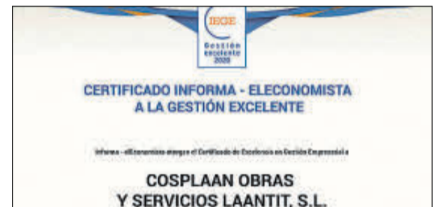
Sus representantes no pudieron acudir.

Denominación Social: Construplas Forma jurídica: Sociedad Limitada Ubicación: Castellón Número de Empleados: 200 Facturación: 30 millones