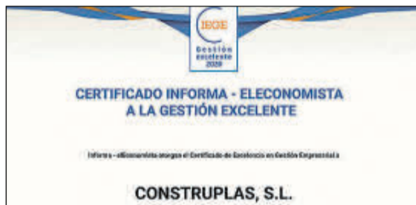
Sus representantes no pudieron acudir.

Denominación Social: Conserveros Reunidos Forma jurídica: Sociedad Limitada Ubicación: A Coruña Número de Empleados: 29 Facturación: 12 millones