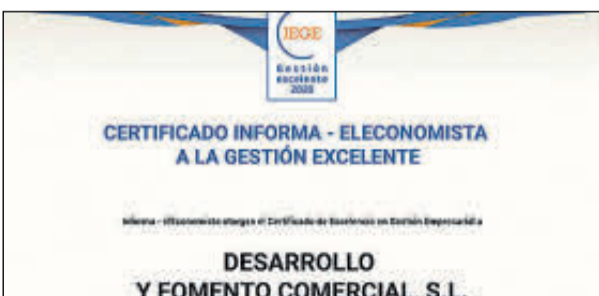
Sus representantes no pudieron acudir.

Denominación Social: Cosplaan Obras y Servicios Laantit Forma jurídica: Sociedad Limitada Ubicación: Barcelona Facturación: 13 millones