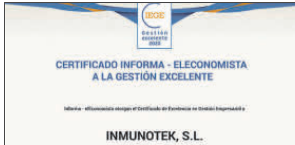
Sus representantes no pudieron acudir.

Denominación Social: Herrero Brigantina Forma jurídica: Sociedad Anónima Ubicación: Madrid Número de Empleados: 101 Facturación: 12 millones