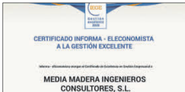
Sus representantes no pudieron acudir.

Denominación Social: Marloplast Envases Forma jurídica: Sociedad Limitada Ubicación: Sevilla Número de Empleados: 7 Facturación: 1,5 millones