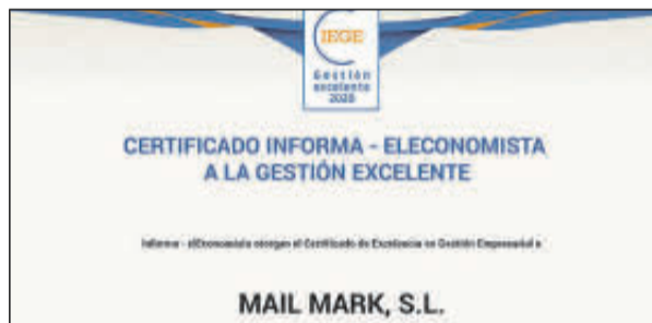
Sus representantes no pudieron acudir.

Denominación Social: Logística Codecar Forma jurídica: Sociedad Limitada Ubicación: Almería Número de Empleados: 9 Facturación: 4,5 millones