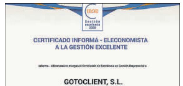
Sus representantes no pudieron acudir.

Denominación Social: Gestión del Valor y Soluciones Forma jurídica: Sociedad Limitada Ubicación: A Coruña Facturación: 2,7 millones