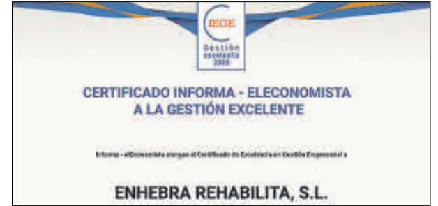
Sus representantes no pudieron acudir.

Denominación Social: Emiral Freelance Group Forma jurídica: Sociedad Limitada Ubicación: Madrid Facturación: 1 millón