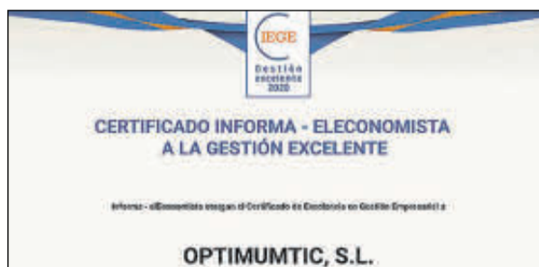
Sus representantes no pudieron acudir.

Denominación Social: Murprotec España Forma jurídica: Sociedad Limitada Ubicación: Barcelona Número de Empleados: 100 Facturación: 23 millones