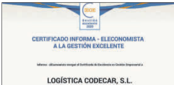
Sus representantes no pudieron acudir.

Denominación Social: Lice Forma jurídica: Sociedad Limitada Ubicación: Navarra Número de Empleados: 33 Facturación: 8,1 millones